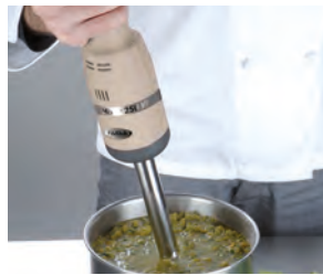
Semplicità d'uso User friendly