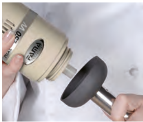
Estrema facilità di smontaggio utensile. Impugnatura ergonomica Easy accessory changing clutch. Ergonomic handle