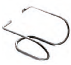
FSPM Supporto parete mini per mixer 250 Wall support for mixer 250