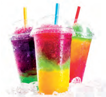
Ghiaccio da granita For the preparation of slush drinks