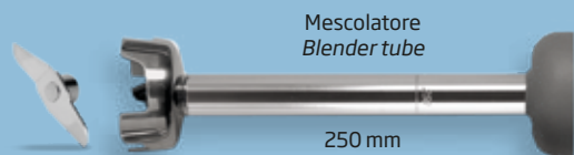
Mescolatore Blender tube