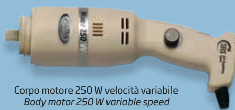
Corpo motore 250 W velocità variabile Body motor 250 W variable speed