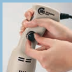
Impugnatura ergonomica e Variatore di velocità Ergonomic handle and Speed Variator

Power: 250 watt Total length with blender tube 250: 520 mm Diameter: Ø 75 mm Weight: 1,5 kg