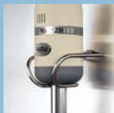
Supporto parete mini per mixer 250 Mini Wall Support for 250 Mixer