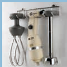
Supporto parete mini per mixer 250 Combi Mini Wall Support for 250 Combi Mixer