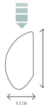
INGRESSO CAPACITÀ STANDARD STANDARD CAPACITY INLET