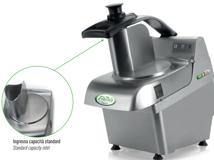
Ingresso capacità standard Standard capacity inlet