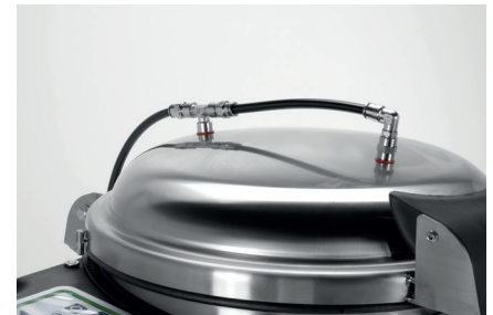
UGELLI PER LAVAGGIO TARTUFI TRUFFLE WASH NOZZLES Di serie / Included